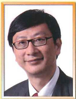
香港教育學院副校長（學術）