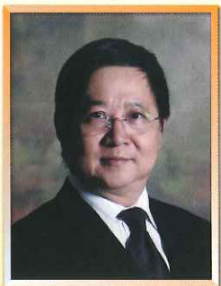
安老事務委員會主席