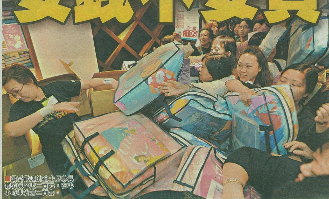
■最受歡迎的迪士尼牀具 套裝減至近二百元，在半 小時即沽清二百套。