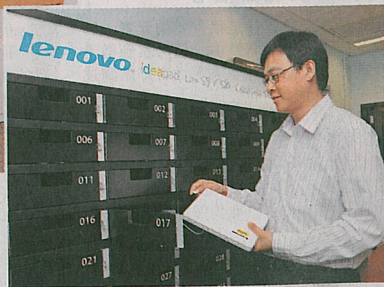
▶Lenovo於電腦室旁設置充電中心，以備學生不時之需。