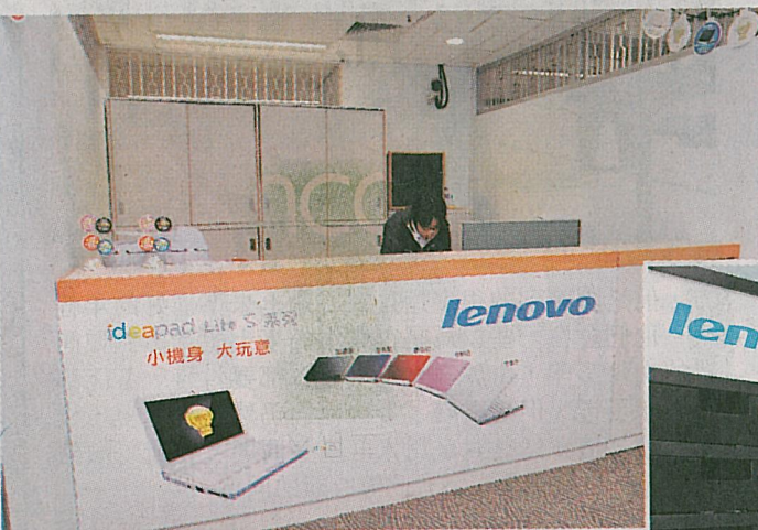
▲Lenovo於校園內設保養維修中心，讓學生遇到任何問題時，可以即時獲得技術支援。