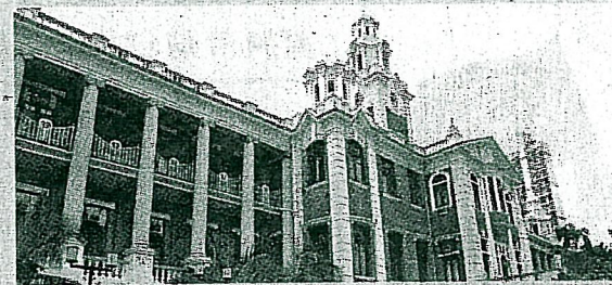
■配合電盈推廣WiFi服務，九大專院校生將可免費使用。

電盈大力推廣WiFi，他不擔心會與流動電話業務構成競爭，因為兩者定位不同。至於電訊營辦商大幅調高電話收費會否引發網上行寬頻加價，陳紀新無正面回應，當然會留意市場發展。